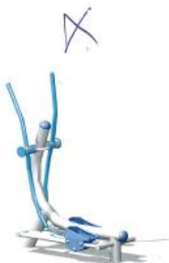
CB-01 1365'98 €